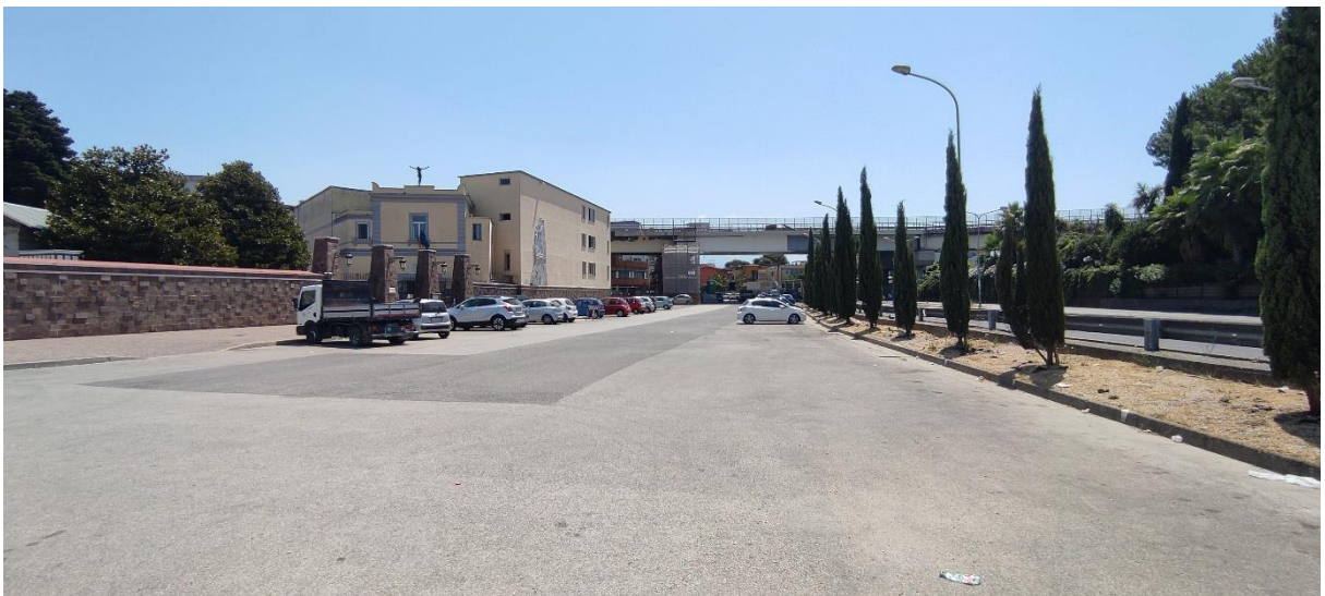
Figura 4 –Area d'intervento