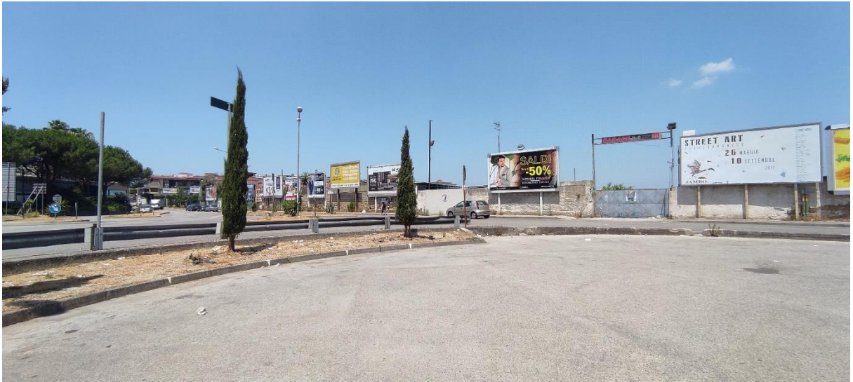
Figura 3 –Area d'intervento