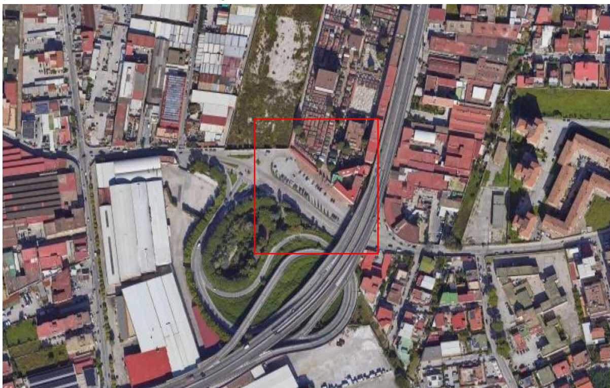
Figura 1 - Inquadramento territoriale

Al fine sopra descritto l'area individuata è ubicata nel territorio del Comune di Arzano alla via Porziano nell'area antistante l'ingresso principale del cimitero consortile Arzano-Casoria-Casavatore, la cui consistenza è indicata nello stralcio aerofotogrammetrico che allegato al presente atto ne forma parte integrante;